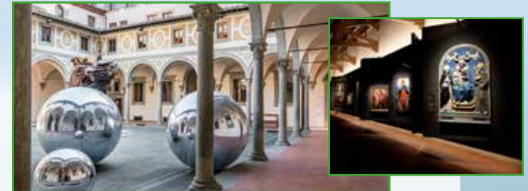
Museo degli Innocenti

12:30 Lunch at Lorenzo de' Medici, a typical restaurant in the centre of Florence