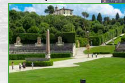
Giardini di Boboli