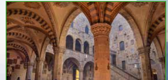
Museo del Bargello