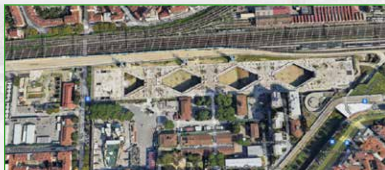
Cantiere nuova stazione AV di Firenze