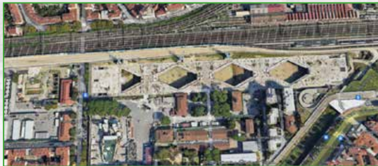
Cantiere nuova stazione AV di Firenze