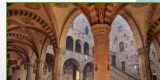
Museo del Bargello