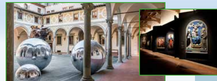
Museo degli Innocenti