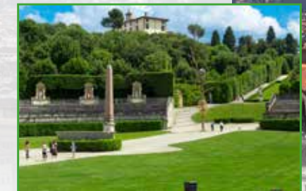
Giardini di Boboli